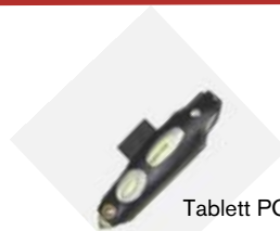
Tablett PC Schutzhülle